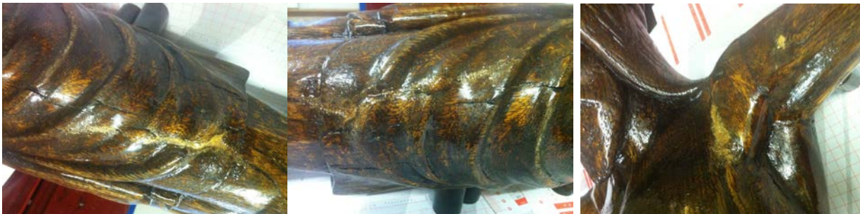
Na het inkleuren